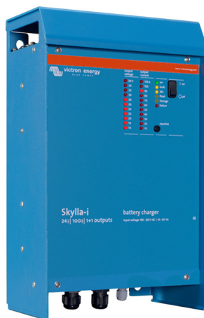
Skylla-i 24/100 (1+1)

Pour de plus amples informations sur les batteries et leurs méthodes de charge vous pouvez consulter notre livre « L'Énergie Sans Limites » (disponible gratuitement chez Victron Energy et téléchargeable sur www.victronenergy.com ).