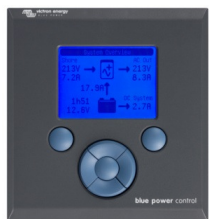
Tableau de contrôle Blue Power

Un solution pratique et bon marché pour une surveillance à distance, avec un bouton rotatif pour configurer les niveaux de Power Control et Power Assist.