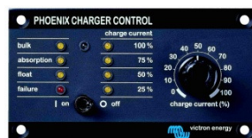
Tableau 'Phoenix Charger Control'

Alarme visuelle et sonore en cas de tension batterie trop haute ou trop basse. Seuils de déclenchement réglables. Contact sec pour signalisation déportée.