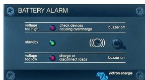
Tableau 'Battery Alarm'

Alarme visuelle et sonore en cas de tension batterie trop haute ou trop basse. Seuils de déclenchement réglables. Contact sec pour signalisation déportée.