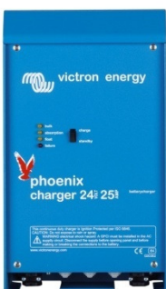
Phoenix charger 24V 25A